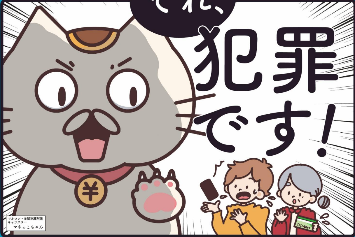
マネロン・金融犯罪対策 キャラクター マネっこちゃん