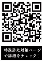
特殊詐欺対策ページ で詳細をチェック！